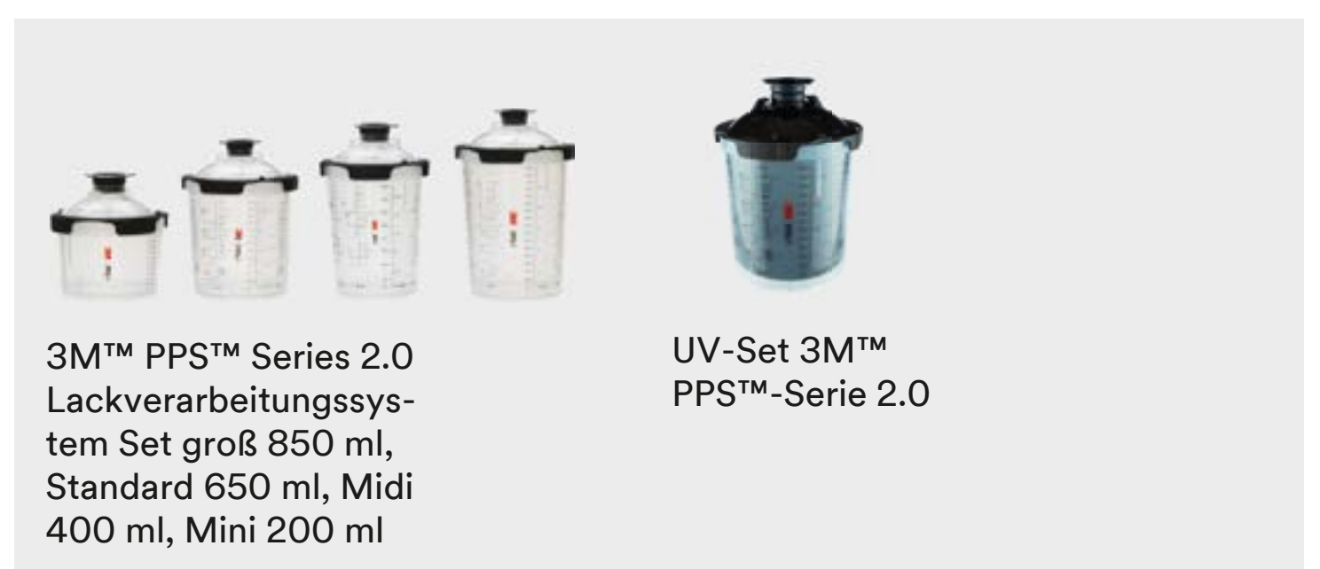
3M™ PPS™ Serie 2.0 Lackverarbeitungssystem Set groß 850 ml, Standard 650 ml, Midi 400 ml, Mini 200 ml