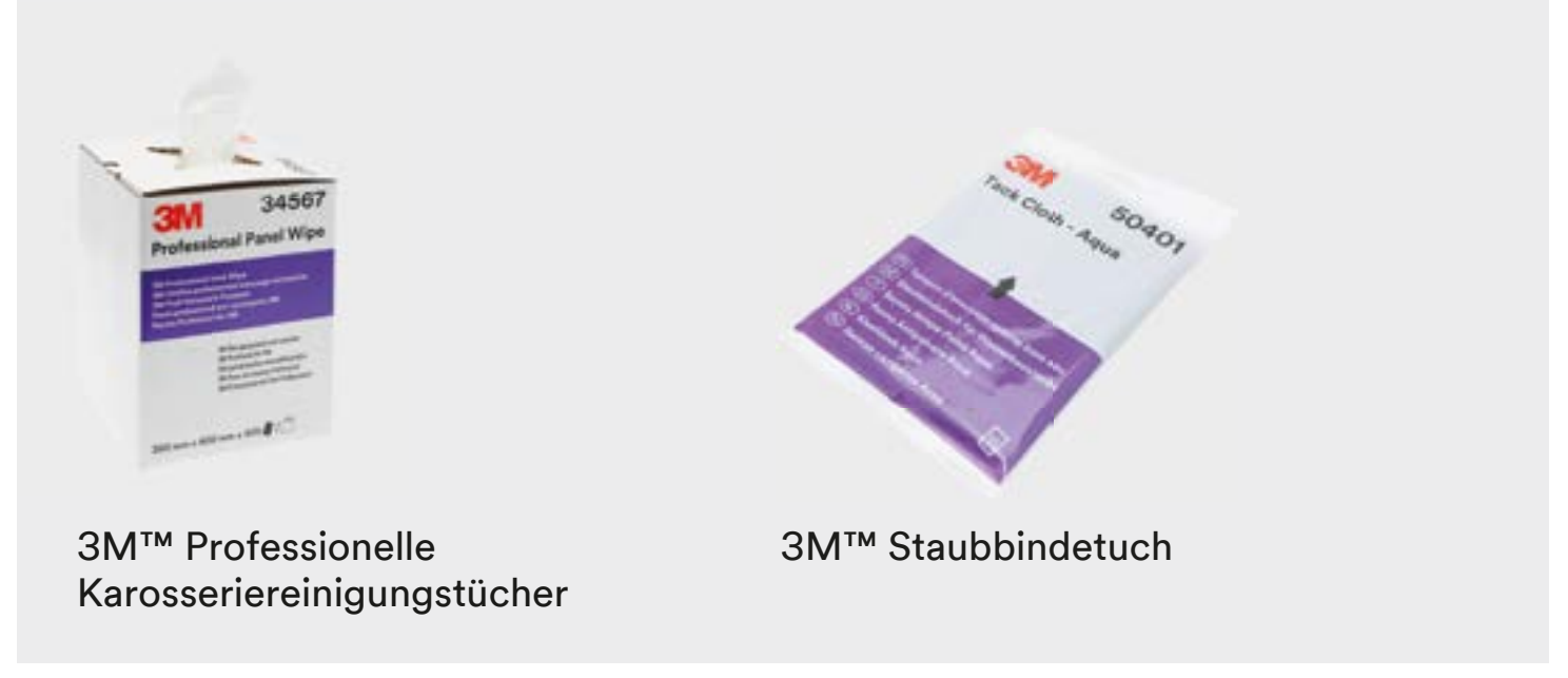
3M™ Professionelle Karosseriereinigungstücher