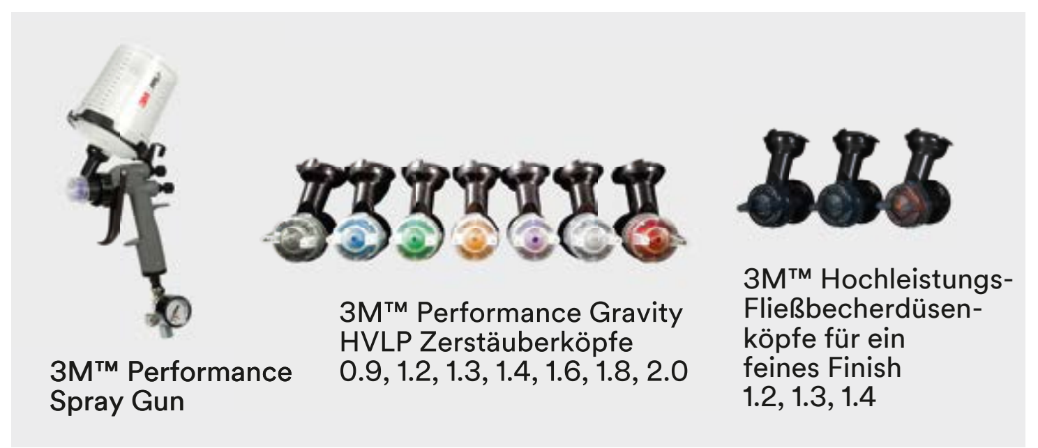
3M™ Performance Spray Gun