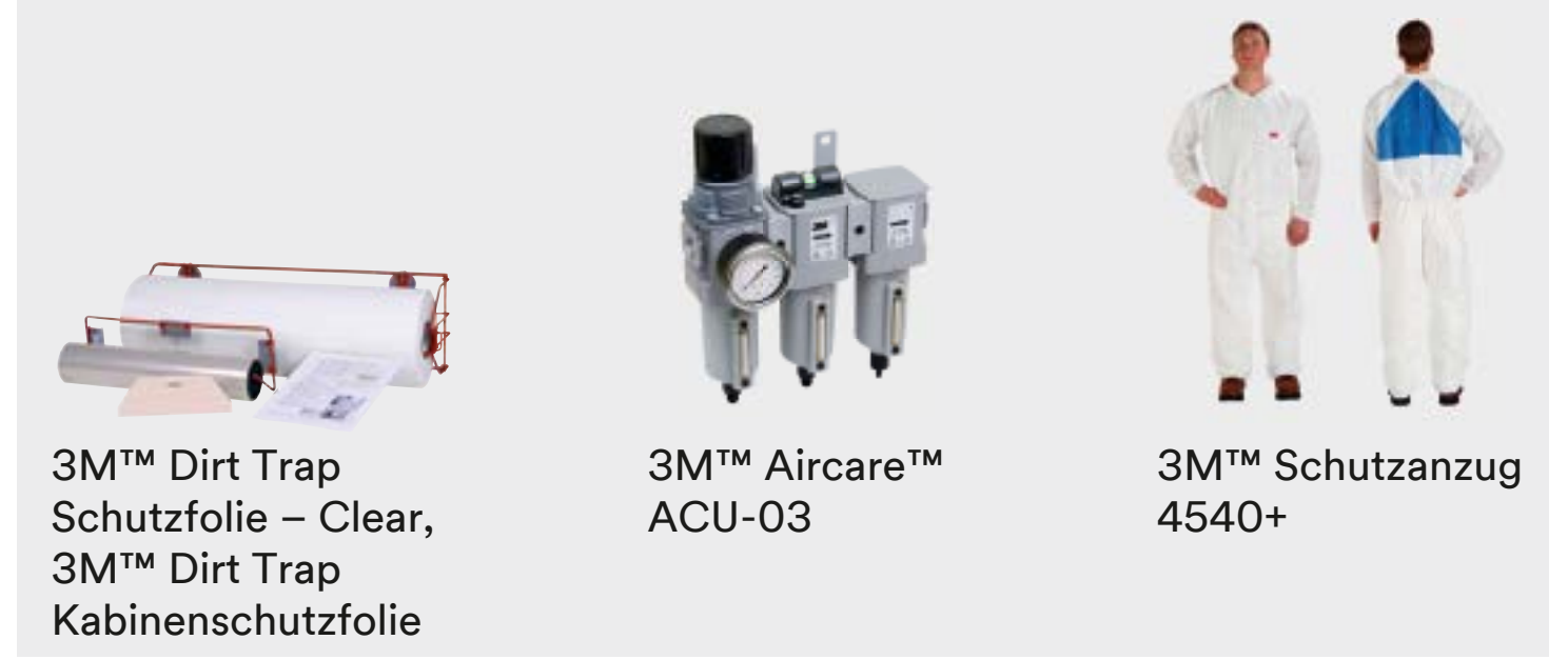
3M™ Dirt Trap Schutzfolie – Clear, 3M™ Dirt Trap Kabinenschutzfolie