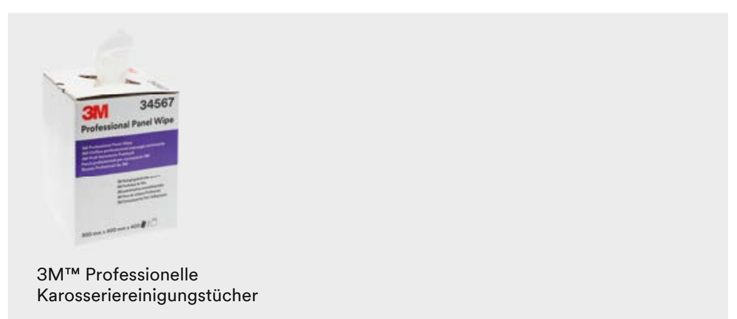
3M™ Professionelle Karosseriereinigungstücher