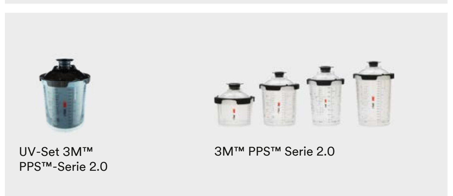
UV-Set 3M™ PPS™-Serie 2.0