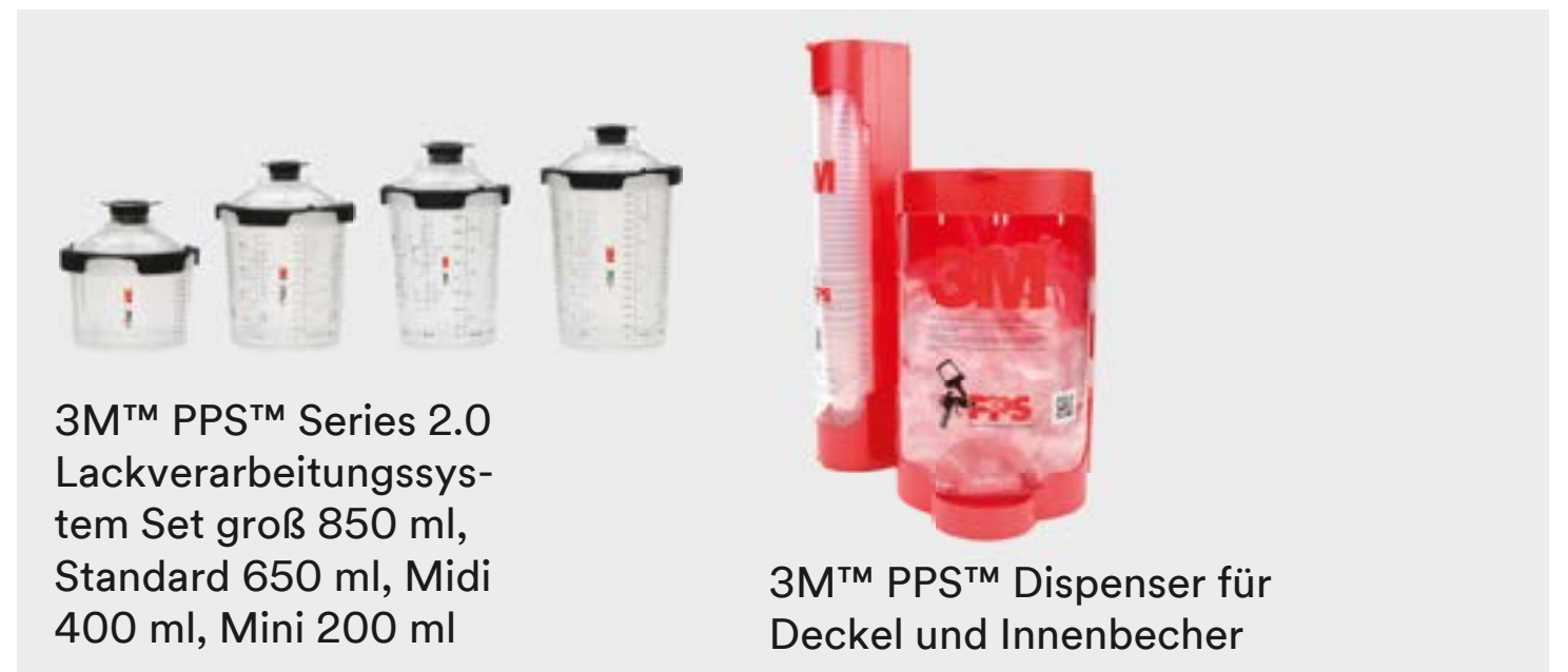
3M™ PPS™ Serie 2.0 Lackverarbeitungssystem Set groß 850 ml, Standard 650 ml, Midi 400 ml, Mini 200 ml

Hinweis: Die Auswahl des richtigen Formats für Ihren Bedarf reduziert das Risiko der Übermischung des Basislack-Materials.