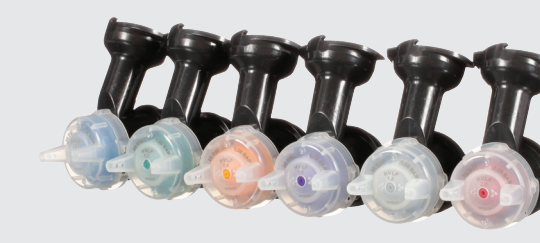
3M™ Performance Gravity HVLP Atomising Heads, 1.2, 1.3, 1.4, 1.6, 1.8, 2.0mm