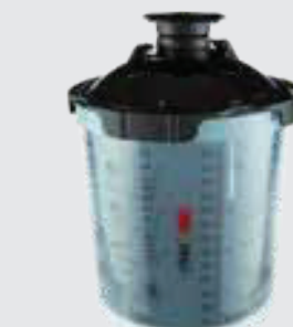
UV-Set 3M™ PPS™-Serie 2.0