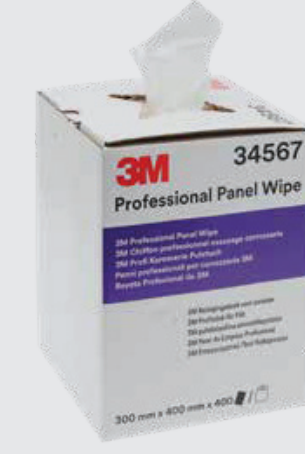
3M™ Professionelle Karosseriereinigungstücher