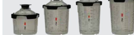
3M™ PPS™ Series 2.0 Lackverarbeitungs-system Set groß 850 ml, Standard 650 ml, Midi 400 ml, Mini 200 ml

Hinweis: Die Auswahl des richtigen Formats für Ihren Bedarf reduziert das Risiko der Übermischung des Basislack-Materials.