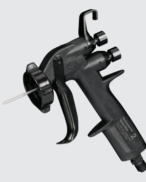
3M™ Performance Spray Gun 2 / 3M™ Performance Spray Gun