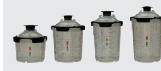
3M™ PPS™ Series 2.0 Lackverarbeitungs-system Set groß 850 ml, Standard 650 ml, Midi 400 ml, Mini 200 ml

Hinweis: Moderne Klarlack-Technologien dürfen aufgrund der kurzen Verarbeitungszeit erst bei Bedarf gemischt werden! Wählen Sie das richtige Format für Ihren Bedarf, um während der Reaktionszeit nicht zu viel Klarlack auf das Material aufzutragen!