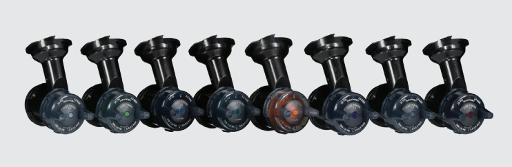
3M™ Hochleistungs-Fließbecherdüsenkopf für ein feines Finish, 0,9, 1,1, 1,2, 1,3, 1,4, 1,6, 1,8, 2,0mm