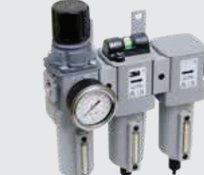
3M™ Aircare™ ACU-03