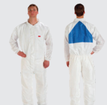
3M™ Schutzanzug 4540+