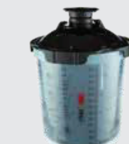
UV-Set 3M™ PPS™-Serie 2.0