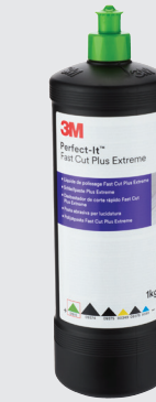
3M™ Perfect-It™ Schleifpaste Plus Extrem 1ltr

Hinweis: Die Erstellung einer persönlichen Farbbibliothek macht das Leben für Sie in der Zukunft leichter, da Sie Ihre eigenen Sprayout-Karten wiederverwenden können.