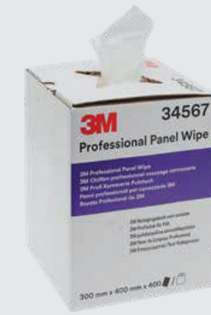
3M™ Professionelle Karosseriereinigungstücher