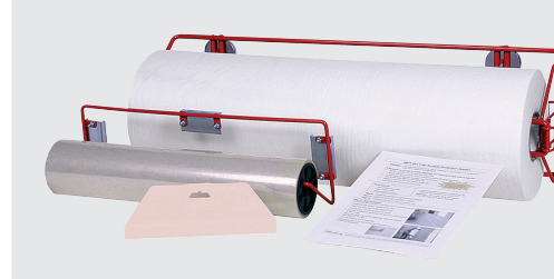
3M™ Dirt Trap Schutzfolie – Clear, 3M™ Dirt Trap Kabinenschutzfolie