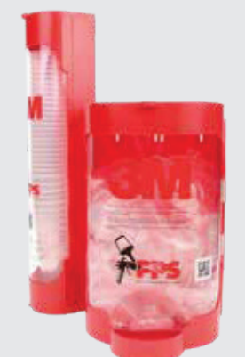
3M™ PPS™ Dispenser für Deckel und Innenbecher