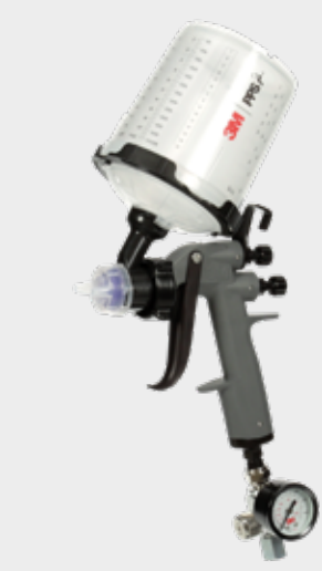
3M™ Accuspray™ HG14 - pohjamaaliruisku