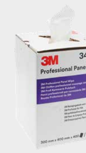
3M™ Professional Puhdistusliinat