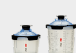
3M™ PPS™ 2.0 Sarjan maalinsekoitusjärjestelmä Large 850 ml, Std 650 ml, Midi 400 ml, Mini 200 ml