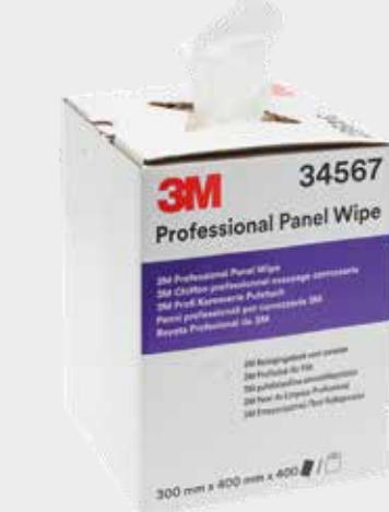
3M™ Professional Puhdistusliinat