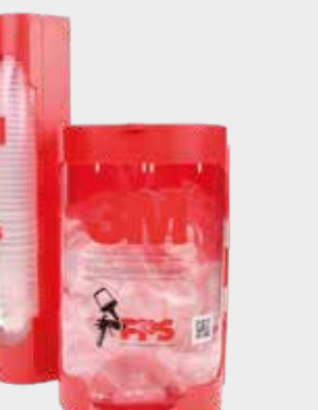
3M™ PPS™ kansi ja sisäastia seinätelineet