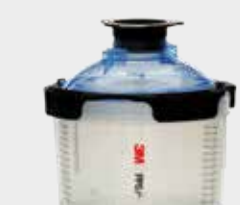
3M™ PPS™ 2.0 Sarja Mini, 200 ml