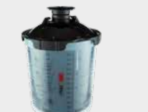
3M™ PPS™ 2.0 Sarjan UV-Kit