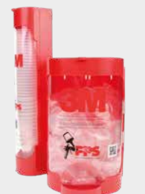
3M™ PPS™ kansi ja sisäastia seinätelineet