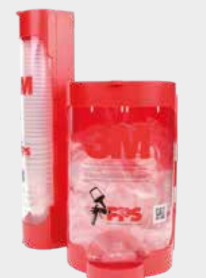
3M™ PPS™ Lid&Liner Dispensers