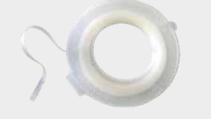
3M™ Smooth Transition -häivytysteippi