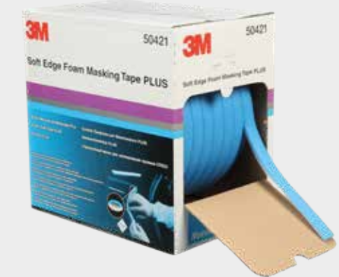
3M™ Soft Edge PLUS -vaahtomuoviteippi