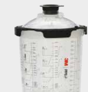
3M™ PPS™ 2.0 Sarja Midi, 400 ml