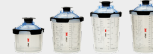
3M™ PPS™ 2.0 Sarjan maalinsekoitusjärjestelmä Large 850 ml, Std 650 ml, Midi 400 ml, Mini 200 ml