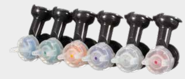
3M™ PPS™ 2.0 Sarjan suutinpää, täyttöpakkaus 1,2,1,3,1,4,1,8, 2,0