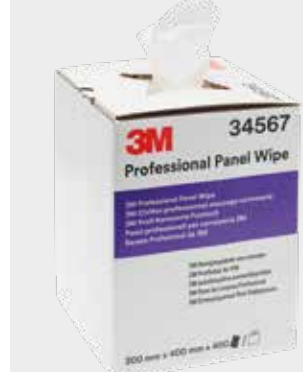
3M™ Professional Panel Wipes