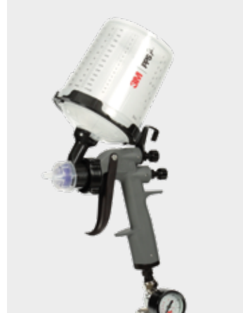
3M™ Performance Spray Gun