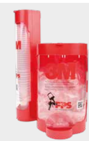
3M™ PPS™ Lid&Liner Dispensers