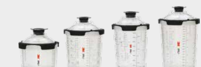
3M™ PPS™ Series 2.0