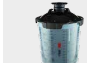
3M™ PPS™ 2.0 Sarjan UV-Kit