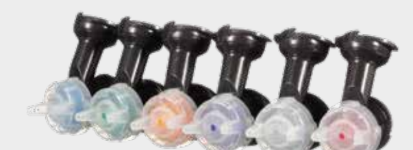
3M™ Performance Gravity HVLP Atomizing Heads 1.2,1.3,1.4,1.8, 2.0