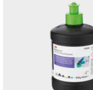
3M™ Perfect-it™ Fast Cut Plus Extreme

Vinkki: Henkilökohtaisen sävykirjaston luominen helpottaa elämäsi jatkossa, kun voit käyttää omia sävymallikortteja uudelleen.