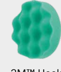
3M™ Hookit™ Convulved Foam, 75mm