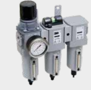
3M™ Aircare ACU-03