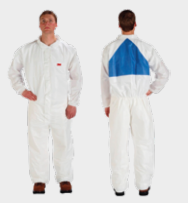
3M™ Protective Coverall 4540+