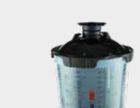
3M™ PPS™ 2.0 Sarjan UV-Kit