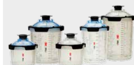
3M™ PPS™ Series 2.0 Spray Cup System Kit Large 850ml, Standard 650ml, Midi 400ml, Mini 200ml