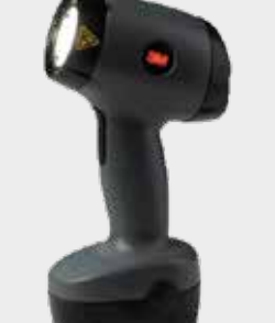
3M™ PPS™ Colour Check Light II