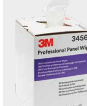
3M™ Professional Panel Wipes PN 34567