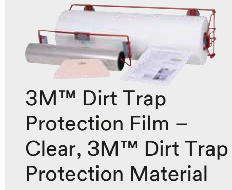
3M™ Dirt Trap Protection Film - Clear, 3M™ Dirt Trap Protection Material