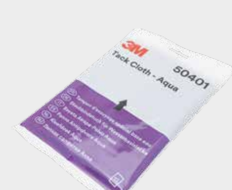
3M™ Tack Cloth Aqua