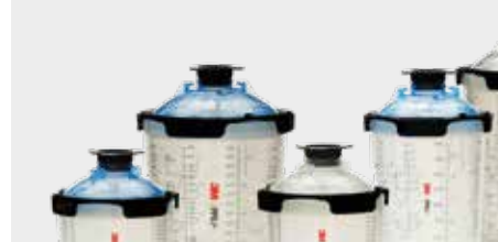
3M™ PPS™ Series 2.0 Spray Cup System Kit Large 850ml, Standard 650ml, Midi 400ml, Mini 200ml