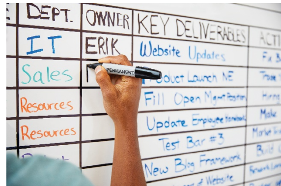
ポスト・イット® 油性ペンも使えるホワイトボードフィルム