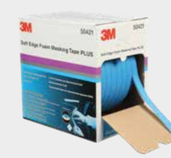
3M™ lágy szélű maszkolószalag PLUS

▶ Vágja a maszkolófóliát megfelelő méretűre, és ragassza a maszk szélére 3M maszkolószalaggal.