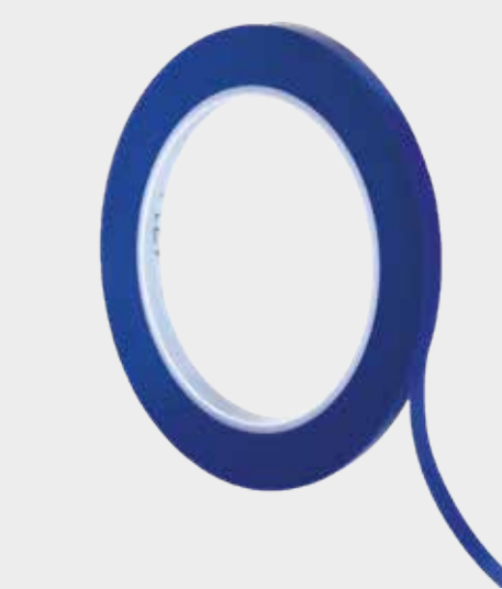
3M™ 471+ Fine Line maszkolószalagok

▶ Maszkolja le az egyéb felületeket: gumikat, díszítőelemeket stb.