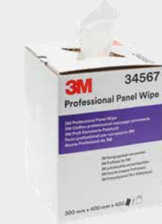
3M™ zsírtalanító szilikonmentesítő kendők

▶ Zsírtalanítsa a felületet a festék gyártója vagy más által javasolt termékkel. Mindig kövesse a gyártó utasításait.