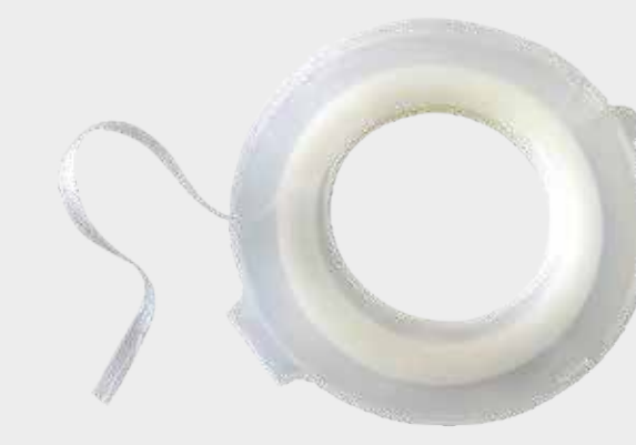
3M™ elfújó szalag

Megjegyzés: Alapozó maszkolása során ne képezzen éles határokat. Emiatt felpuffadhat a felület, mivel túl sok oldószer gyűlik össze a szalag szélénél.