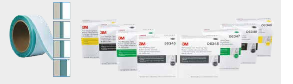
3M™ perforált maszkolószalag

4 Durva takarás az alapozó felhordása előtt