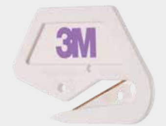
3M™ Premium vágószerszám