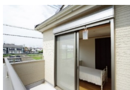
虫除けなどの設置に