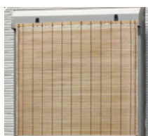
すだれの取り付けに