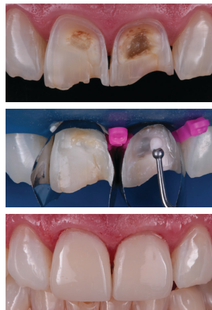
Dr. Paulo Monteiro

Materiał kompozytowy 3M™ Filtek™ Universal w odcieniu Pink Opaquer odznacza się nieskończoną grubością optyczną przy grubości fizycznej wynoszącej tylko 1 mm. Skutecznie maskuje przebarwienia oraz widoczne metalowe elementy. Pink Opaquer jest jednym z odcieni materiałów kompozytowych Filtek Universal. Unikatowe połączenie nanowypełniaczy, chronionych patentami monomerów o niskim naprężeniu i pigmentów zapewnia jeden estetyczny odcień, adaptujący się w bardziej naturalny sposób do pozostałych zębów w odcinku przednim i bocznym. Ofertę do estetycznej odbudowy uzupełnia dodatkowy odcień XW (Extra White). Ponadto 3M™ Filtek™ Universal jest certyfikowany przez FDA pod względem bezpieczeństwa w podgrzewaniu go do temperatury 70°C.