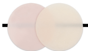
PO (Pink Opaquer) / odcień A1

Teraz możesz zamaskować ciemne przebarwienia wpływające na końcowy efekt estetyczny.