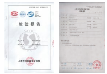
沪预研委消(2019)检字第0590-3号 皮肤刺激检测报告