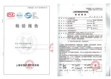
沪预研委消(2019)检字第0590-2号 杀菌性能检测报告