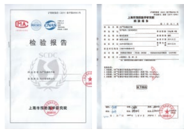
沪预研委消(2019)检字第0590-1号 PH值及重金属检测报告