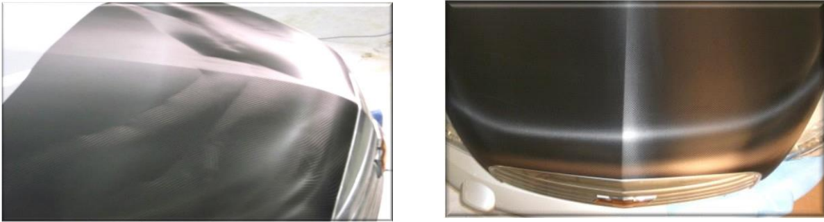
Figura 2. Film danneggiato vs. Film non danneggiato post-installazione