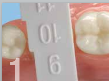
1 Mida y seleccione la corona.

Para información del paso a paso consulte "trucos y consejos".