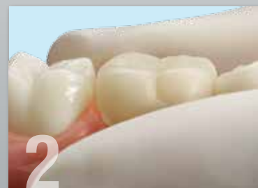
2 Coloque y adapte la corona sobre el diente.