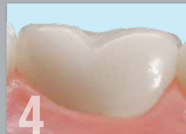
4 Pulido y cementado.