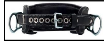
Ceinture de travail pour monteurs de lignes 2D à boucles à ardillon