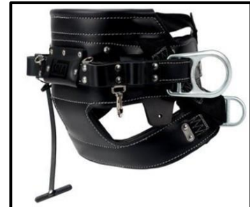
Ceinture de travail pour monteurs de lignes 4D à boucles à ardillon

Veuillez noter : ces Ceintures pour monteurs de lignes 2D et 4D DBI-SALA ® 3M MC respectent les procédures d'essai énoncées dans la sous-partie « M » de l'annexe « D » de la norme 1926 de l'OSHA.