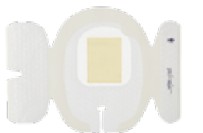
antimikrobiellt och intravenöst fixeringsförband

Den här specialdesignade Curox-desinfektionsproppen är kompatibel med Tego® nålfri hemodialyskoppling.