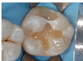
Aplikace flow kompozita