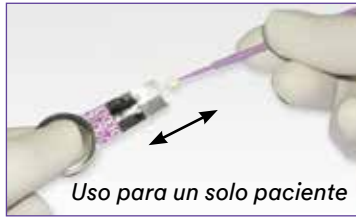
Uso para un solo paciente