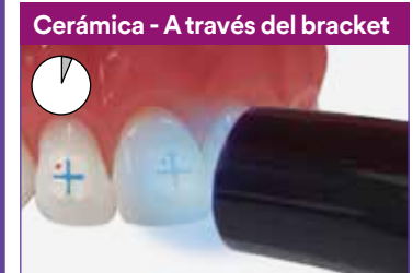
Cerámica - A través del bracket