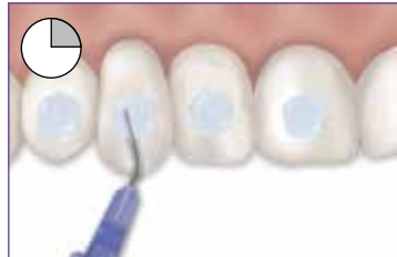
Grabe 15 segundos