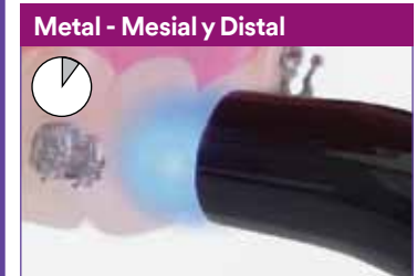
Metal - Mesial y Distal