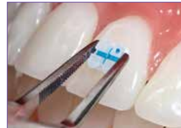
Coloque, posicione, comprima. No limpie alrededor del bracket.