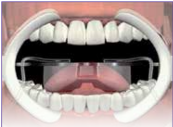
Aisle el diente

Nota: Antes de empezar: Asegure una buena higiene oral