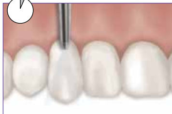
1-2 segundos de una ligera ráfaga de aire