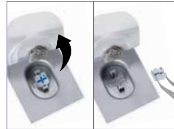
Evite tocar la base del bracket