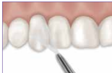
Seque con aire