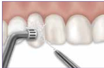
Succión y enjuague