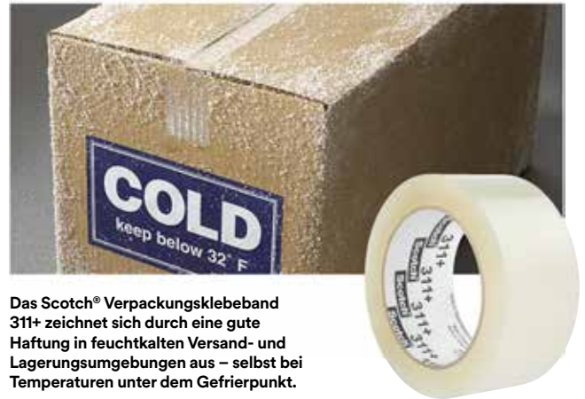
Das Scotch® Verpackungsklebeband 311+ zeichnet sich durch eine gute Haftung in feuchtkalten Versand- und Lagerumgebungen aus – selbst bei Temperaturen unter dem Gefrierpunkt.