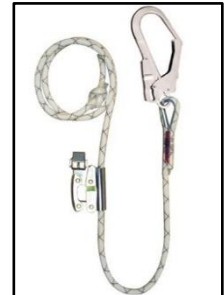
Longe de maintien Manustop