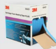
Nastro per mascheratura in schiuma Soft Edge 3M™ PLUS