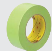
Nastro per mascheratura ad alte prestazioni Scotch® 233+