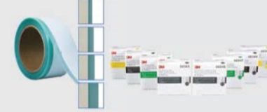
Nastro per mascheratura Trim 3M™