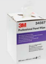
Panno professionale 3M™