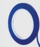
Nastri per mascheratura di linee sottili Scotch® 471+