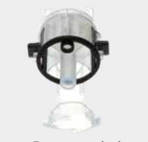
Paquete de boquillas de atomización de recambio 3M™ PPS™ Serie 2.0, 1,8 mm, transparentes