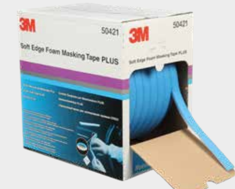
Burlete de enmascarar Premium 3M™