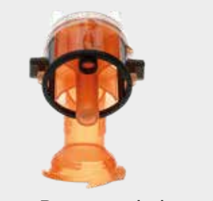
Paquete de boquillas de atomización de recambio 3M™ PPS™ Serie 2.0, 1,4 mm, naranja