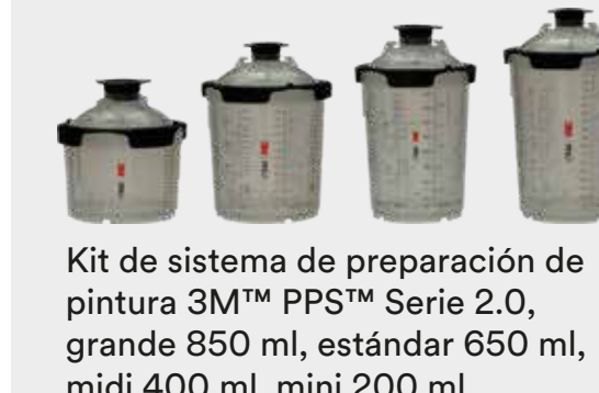
Kit de sistema de preparación de pintura 3M™ PPS™ Serie 2.0, grande 850 ml, estándar 650 ml, midi 400 ml, mini 200 ml