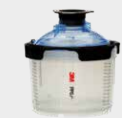
3M™ PPS™ Serie 2.0 Mini, 200 ml