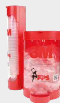
Dispensadores de tapa y vaso desechable 3M™ PPS™