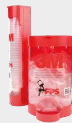
Dispensadores de tapa y vaso desechable 3M™ PPS™