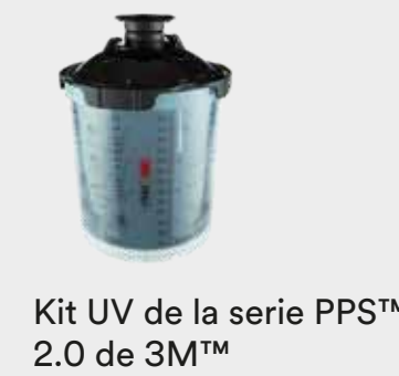
Kit UV de la serie PPS™ 2.0 de 3M™