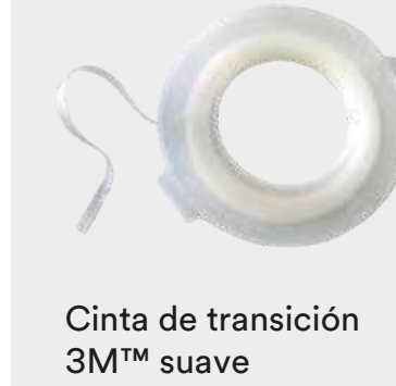
Cinta de transición 3M™ suave