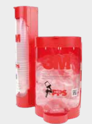
Dispensadores de tapa y vaso desechable 3M™ PPS™