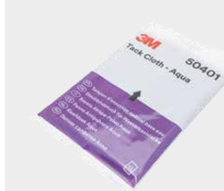
Paño antiestático 3M™