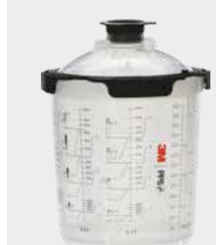
3M™ PPS™ Serie 2.0 Midi, 400 ml