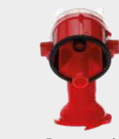
Paquete de boquillas de atomización de recambio 3M™ PPS™ Serie 2.0, 2 mm, rojas