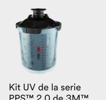
Kit UV de la serie PPS™ 2.0 de 3M™