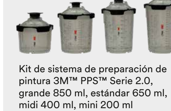
Kit de sistema de preparación de pintura 3M™ PPS™ Serie 2.0, grande 850 ml, estándar 650 ml, midi 400 ml, mini 200 ml