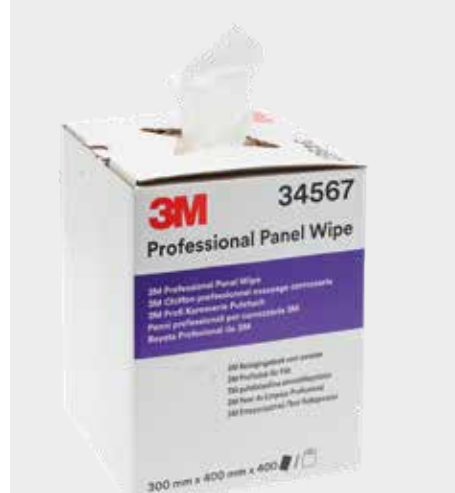
Bayetas profesionales para paneles 3M™ PN 34567