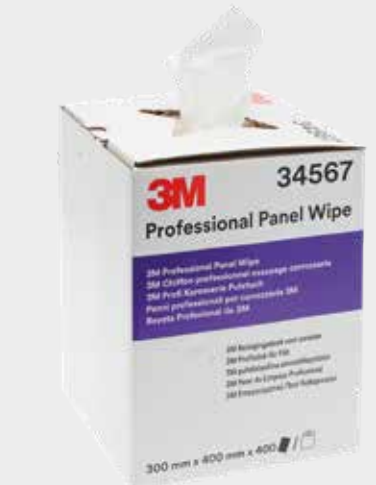
Bayetas profesionales para paneles 3M™