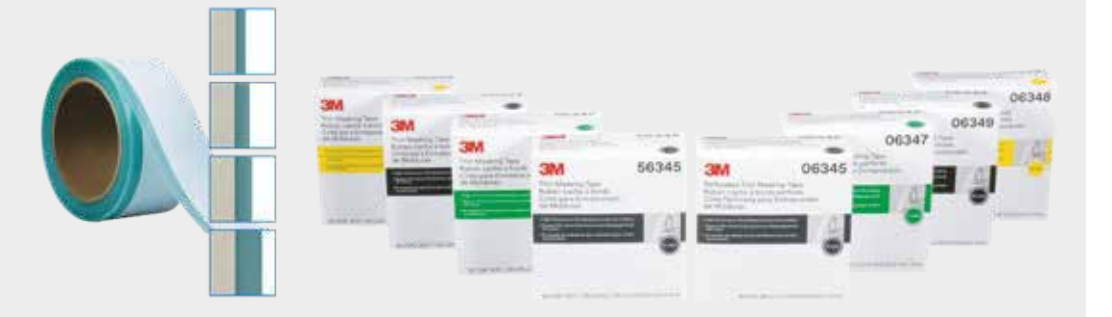
Cinta para enmascarar molduras 3M™