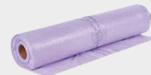
3M™ Morada Premium Funda de enmascarado PLUS 4 m x 150 m, 5 m x 120 m, 6 m x 120 m

► Cubra el vehículo lo antes posible, esto reduce la posibilidad de contaminación del entorno.