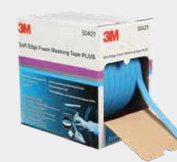
Burlete de enmascarar Premium 3M™

► Corte la funda de plástico de enmascarar al tamaño apropiado y adhiérala al enmascarado del contorno con cintas de enmascarado 3M.