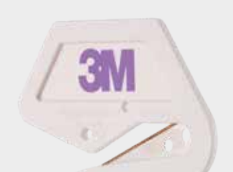
Cuchilla premium 3M™