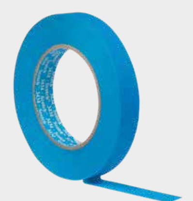
Cinta de enmascarado 3M™ Scotch® 3434