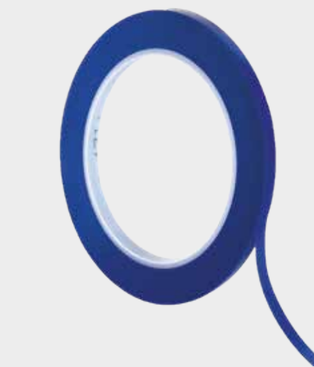
Cintas de enmascarado para líneas finas 3M™ 471+

► Enmascare otras áreas como gomas, molduras, etc.