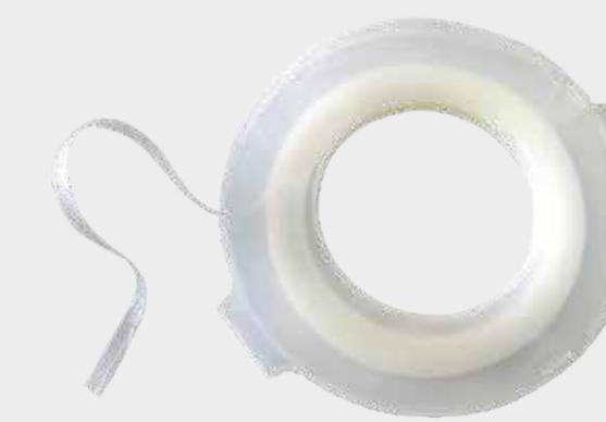
Cinta de transición 3M™ suave

Nota: Evite generar bordes pronunciados al enmascarar la imprimación. Eso hace que se hinche la superficie debido a la concentración de disolventes en los bordes de la cinta.