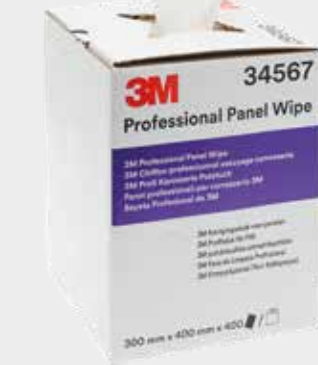
Bayetas profesionales para paneles 3M™

► Desengrase la superficie con el producto de la marca de pintura u otro producto recomendado. Siga siempre las instrucciones de uso del fabricante.