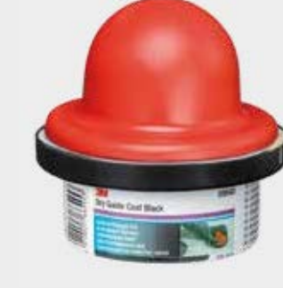
Guía de lijado en seco 3M™