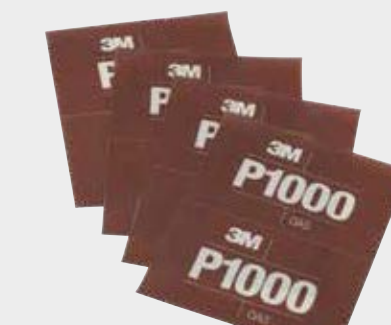
Hojas abrasivas flexibles 3M™ Hookit™