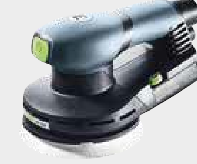
Festool ETS EC 150/3