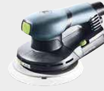
Festool ETS EC 150/5 EQ