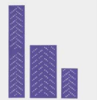
Hojas abrasivas 3M™ Cubitron™ II 737U