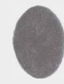
Discos abrasivos 3M™ Scotch-Brite™