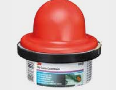
Guía de lijado en seco 3M™