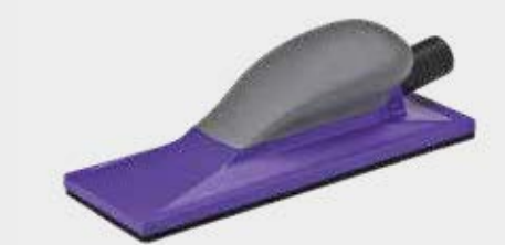
Taco manual púrpura 3M™ Hookit™