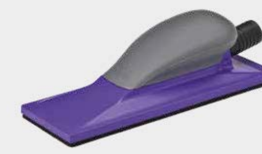
Taco manual púrpura 3M™ Hookit™