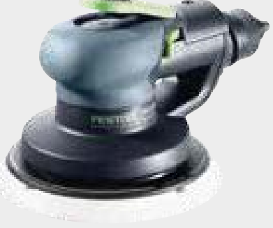
Festool LEX 3 150/3