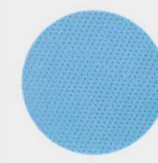
Disco de espuma flexible 3M™ Hookit™