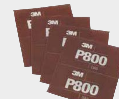
Hojas abrasivas flexibles 3M™ Hookit™