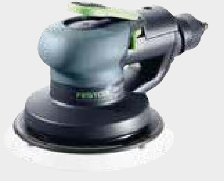
Festool LEX 3 150/5, Festool LEX 3 150/7