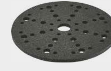
Interface de lijado Festool