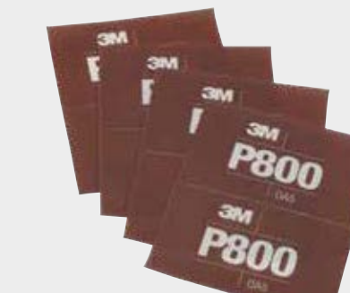
Hojas abrasivas flexibles 3M™ Hookit™