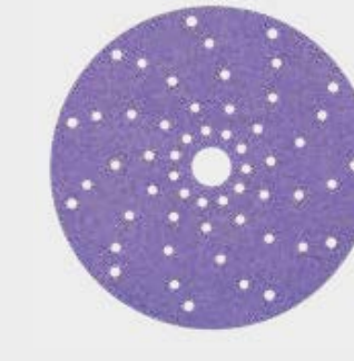
Disco 3M™ Cubitron™ II 737U