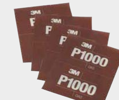
Hojas abrasivas flexibles 3M™ Hookit™