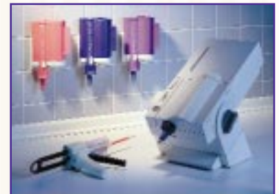
El Material de Impresión Impregum™ Consistencia Liviana se encuentra disponible en los siguientes sistemas de dispensado: Sistema de Mezcla Pentamix™ y Sistema de Automezcla Garant™.