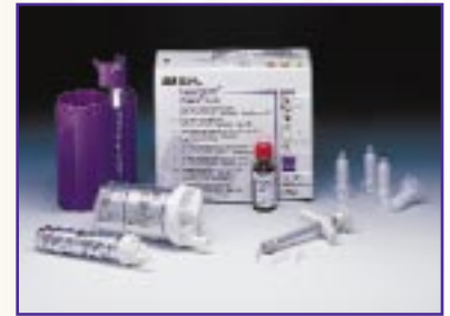
Material de Impresión Impregum™ Penta™ Soft Consistencia Mediana.