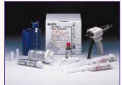
Material de Impresión Impregum™ Penta™ DuoSoft Consistencia Pesada/Liviana.