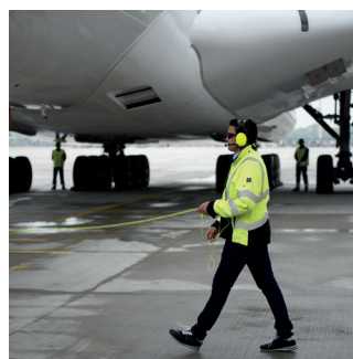
Maintenance des avions