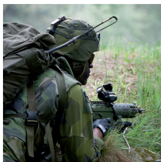
Armée et forces de l'ordre