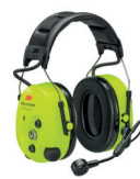
3M™ PELTOR™ WS™ ProTac XPI