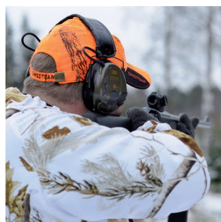
Chasse et tir sportif