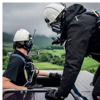
Énergie et services publics