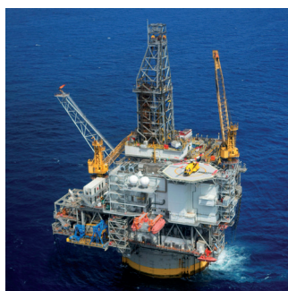
Industries du pétrole et gaz

Pour garantir une utilisation facile de nos produits et un bon fonctionnement dans tous les environnements, nous utilisons des technologies avancées telles que la modulation sonore et le Bluetooth®.