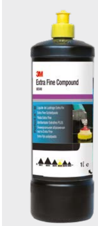
3M™ Perfect-It™ Extra Fine PLUS

► Usuń nadmiar środka polerskiego i obejrzyj powierzchnię – w przypadku większości kolorów to powinno wystarczyć.