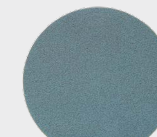
3M™ Trizact™ Krążek do wykańczania 5000, 150 mm