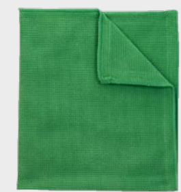
3M™ Ściereczka polerska