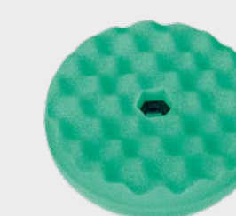
3M™ Perfect-It™ Zielona dwustronna karbowana gąbka polerska Quick Connect