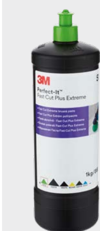
3M™ Perfect-It™ Fast Cut Plus Extreme

Uwaga: Im miększa powłoka, tym niższa temperatura, a zatem również prędkość obrotowa.