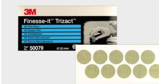
466LA Trizact™ Krążki A5 3000

► Usuń wtrącenia za pomocą krążka na foliowym podłożu 3M™ Finesse-it™ Trizact™, 32 mm, o gradacji 3000 na narzędziu do usuwania wtrąceń