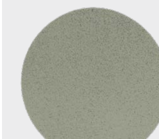
3M™ Trizact™ Krążek do wykańczania 3000, 150 mm

► Szlifowanie obszaru przy użyciu 3M™ Trizact™ Krążka do wykańczania 443SA o gradacji 3000, 150 mm na szlifierce oscylacyjnej.