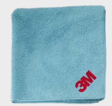
3M™ Perfect-It™ Ściereczka polerska