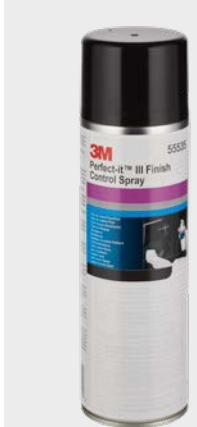
3M™ Perfect-It™ Aerosol do kontroli wykończenia powierzchni

Uwaga: Ważne jest, aby na tym etapie usunąć wszystkie rysy powstałe podczas szlifowania, aby uniknąć ich ponownego wystąpienia pod koniec procesu polerowania.