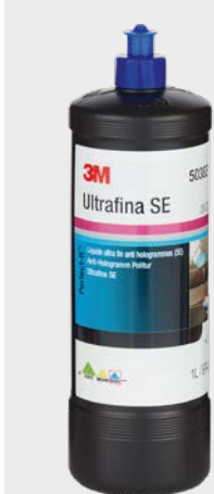
3M™ Perfect-It™ Ultrafina SE

Porada: Gąbka musi być zawsze dobrze nasączona środkiem polerskim, ponieważ to ułatwia równomierne nakładanie go na powierzchnię i zapobiega przed tworzeniem się mikrorys.