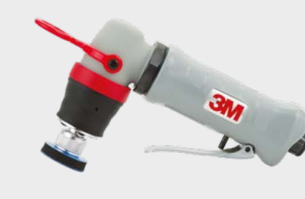
3M™ Miniszlifierka oscylacyjna, ciśnienie powietrza