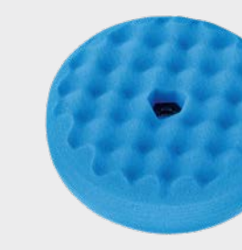
3M™ Perfect-It™ Quick Connect Dwustronna niebieska karbowana gąbka polerska