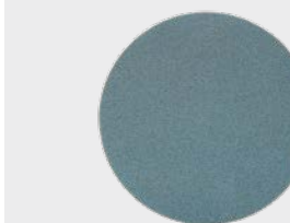
3M™ Trizact™ Krążek do wykańczania 5000, 75 mm

► Usuwanie rys przy użyciu 3M™ Trizact™ Krążka do wykańczania 443SA o gradacji 5000, 75 mm na szlifierce oscylacyjnej.