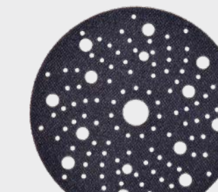
3M™ Hookit™ Przekładka ochronna