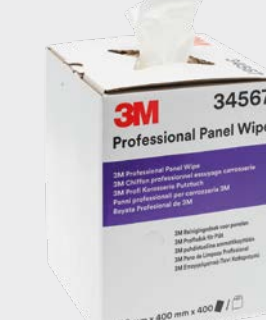
3M™ Profesjonalne ściereczki do paneli