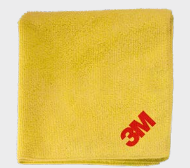
3M™ Perfect-It™ Ściereczka polerska