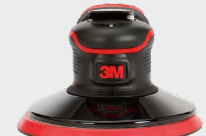
3M™ Precyzyjna szlifierka mimośrodowa 150 mm