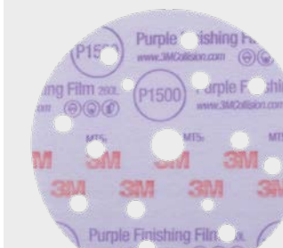
3M™ Hookit™ 260L+

► Szlifowanie obszaru przy użyciu dysku ściernego 3M™ Hookit™ 260L, o gradacji P1500–P2000.