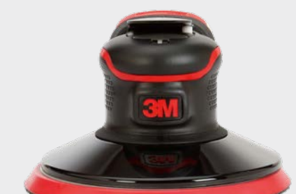
3M™ Precyzyjna szlifierka mimośrodowa 150 mm