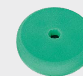
3M™ Perfect-It™ Zielona dwustronna płaska gąbka polerska Quick Connect