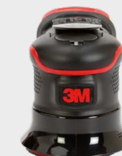
3M™ Precyzyjna szlifierka mimośrodowa 75 mm