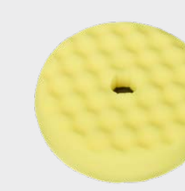
3M™ Perfect-It™ Quick Connect Dwustronna karbowana żółta gąbka polerska