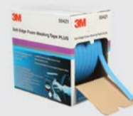
Ruban de masquage en mousse à bords souples PLUS 3M™

► Préparez la zone pour l'application de la peinture, en prévoyant un espace suffisant pour créer des transitions fluides et éviter les bords durs. ► Découpez le film de masquage afin d'atteindre la taille appropriée et fixez-le au contour du masquage à l'aide de rubans de masquage 3M.