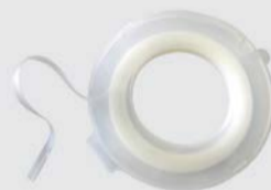
Ruban de transition lisse 3M™

Remarque : Évitez de former des bords durs lors du masquage du primaire. En effet, des gonflements peuvent apparaître sur la surface en raison de la concentration de solvants sur les bords du ruban.