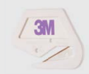
Cutter Premium 3M™