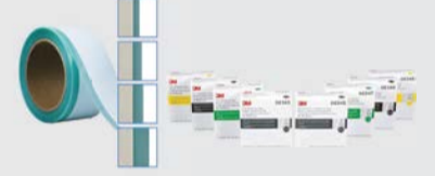
Ruban de masquage des garnitures 3M™