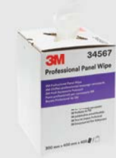
Chiffons professionnels d'essuyage 3M™

► Dégraissez la surface à l'aide d'un produit vendu par le fabricant de peinture ou d'un autre produit recommandé. Suivez toujours les instructions du fabricant.