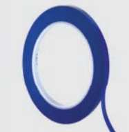
Ruban de masquage fin Scotch® 471+

► Masquez d'autres zones, telles que les caoutchoucs, les garnitures, etc.