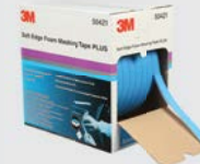
3M™ Soft Edge Foam Masking Tape PLUS