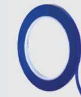
Scotch® Fine Line Maskeertapes 471+