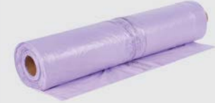
3M™ Purple Premium PLUS Transparante Maskeerfolie 4 m x 150 m, 5 m x 120 m, 6 m x 120 m