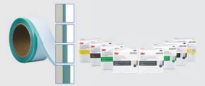
3M™ Trim Masking Tape