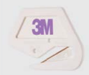
3M™ Premium Cutter