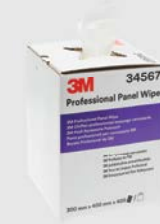
3M™ Professionele Poetsdoeken