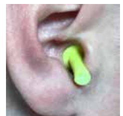
Minima profondità di inserimento raccomandata

Gli individui con condotti uditivi piccoli o ortemente essere in grado di raggiungere questa profondità di inserimento. In tali casi, l'inserimento può ancora essere adeguato, ma deve essere verificato mediante fit test. Se non è disponibile un fit test, utilizzare un altro tipo di dispositivo di protezione per l'udito.