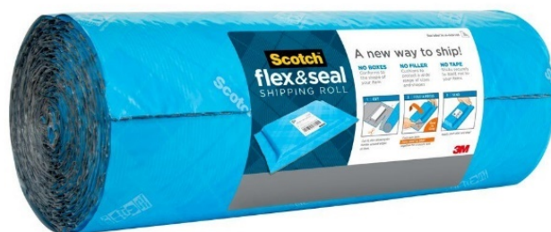
スコッチ™ フレックス&シール 梱包ロール