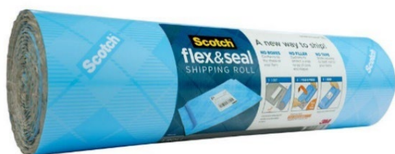
スコッチ™ フレックス&シール 梱包ロール

スリーエム ジャパン株式会社（本社：東京都品川区 代表取締役社長：昆 政彦）が展開するスコッチ™ ブランドは、2020年6月1日、「スコッチ™ フレックス&シール 梱包ロール」を発売します。