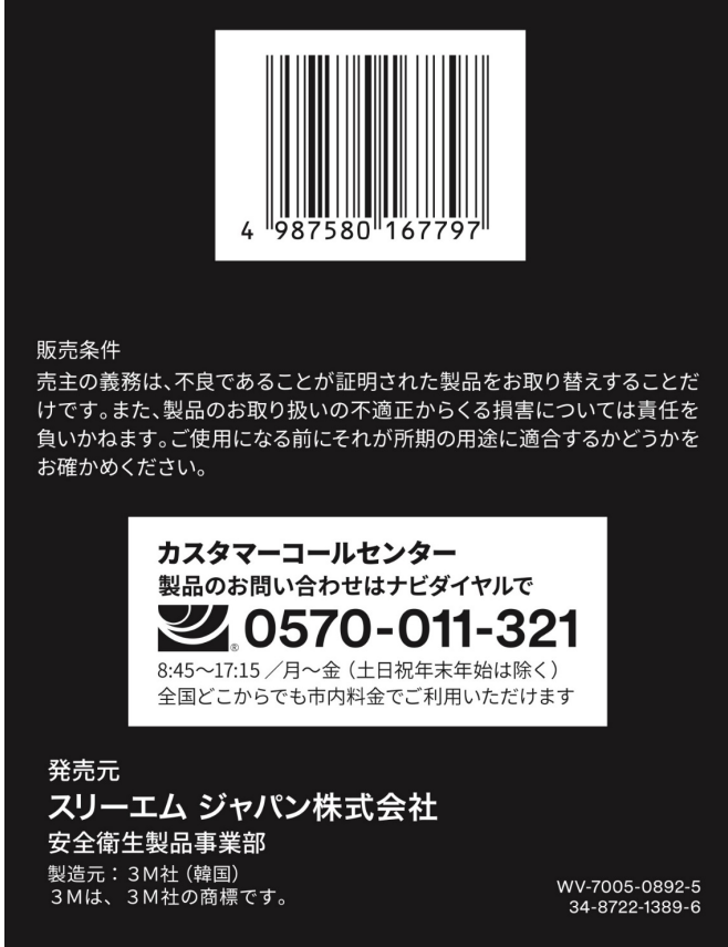
Pkg. of 20