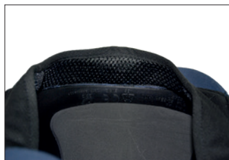
Zweetband met afstelbare achterkant