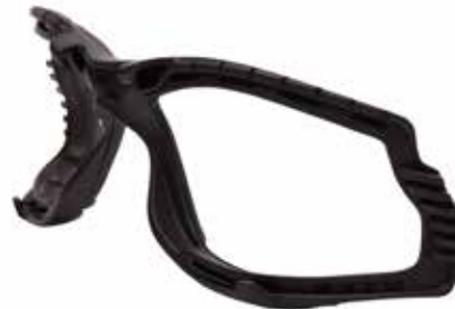
71511-99999 Insert en mousse