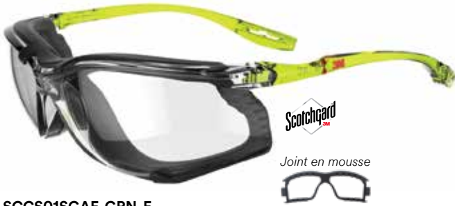
SCCS01SGAF-GRN-F optique : incolore