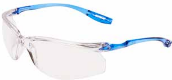
71511-00000 optique : incolore