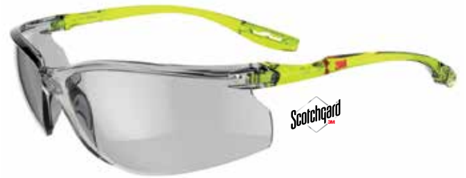
SCCS07SGAF-GRN Glazen: Indoor/Outdoor grijs