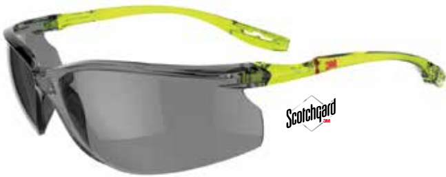
SCCS02SGAF-GRN Glazen: Grijs