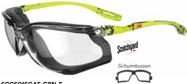
SCCS01SGAF-GRN-F Glazen: Helder