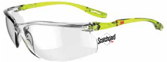
SCCS01SGAF-GRN Glazen: Helder