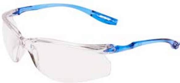
71511-00000 Glazen: Helder