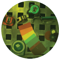
Échantillon de produit concurrent