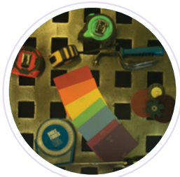
Verre photosensible 9002NC, teinte 3

Les éléments d'optique améliorés du Filtre de soudage Speedglas MC 9002NC vous aident à mieux voir vos soudures sous un nouveau jour, offrant ainsi plus de contraste et des couleurs d'apparence plus naturelle, comme l'illustrent ces photos.