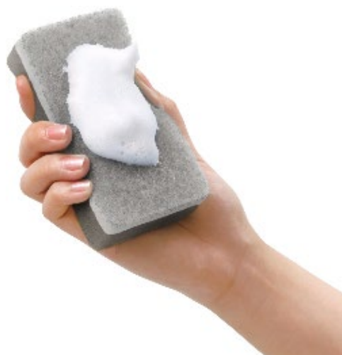
スコッチ・ブライト™ 泡立ちゆたかソフトスポンジ

オープンキッチンが人気を集める中、キッチンのインテリアにもこだわりを持つ人が増えており、スポンジもインテリアに合わせたデザインのものを選ばれる傾向にあります。3Mが実施した、キッチンスポンジの色に関する調査によると、オープンキッチンを使用している20~40代の消費者は、キッチンと馴染む色合い（無彩色）のものを好む人が多いことがわかりました※1。また、キッチンスポンジの購入時は、泡立ちが良い、キズがつかないなどの機能が重視されていることもわかっています※2。