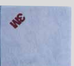
3M™ Perfect-It™ Ultra Soft mikrokuituliina, sininen Tuoteno 30806

Vinkki: Aseta laikan pyörintänopeudeksi 900–1 800 kierrosta minuutissa.