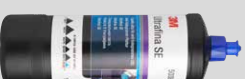
3M™ Perfect-It™ UltraFina SE 1 kg Tuoteno 50383