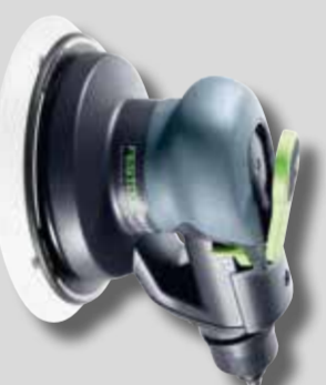
Paineilmakäyttöinen epäkeskohiomakone Festool LEX 3 150 Tuoteno 202795

Poista maalipinnan virheet käyttämällä 260L P2000 -laikkaa tehtävän sopivan kokoisella epäkeskohiomakoneella. Käytä 2,5–5 mm:n epäkeskoliikettä, interface-alustaa ja keskisuurta painetta. Poista hiomajäte, kun maalipinnan kaikki virheet on korjattu.