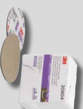
Ø 75 mm 3M™ Trizact™ 8000 Tuoteno 30804

Viimeistele hiottu alue 3M™ Trizact™ 8000 -karkeudella. Hio pinta kosteana, sumuta riittävästi vettä laikalle tai pinnalle. Käytä 5 mm:n epäkeskoliikkeellä olevaa hiomakonetta. Varmista, että käsittelet alueen aiemmin hiottu reuna-alueiden yli. Kuljeta hiomakonetta vähintään viisi kertaa alueen yli 50 prosentin ylityksellä käyttämällä keskisuurta painetta. Poista hiomajäte ja pyyhi pinta puhtaaksi.