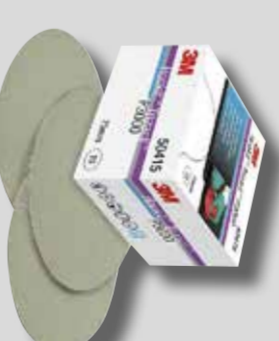
Ø 75 mm 3M™ Trizact™ 3000 Tuoteno 50415