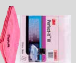
Vaaleanpunainen 3M™ High Performance -mikrokuituliina Tuoteno 50489