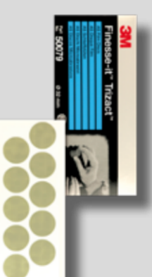
Ø 32 mm, 3M™ Trizact™ 3000 Tuoteno 50079

Viimeistele hiottu alue 3M™ Trizact™ 3000 -karkeudella. Hio pinta kosteana ja ruiskuta riittävästi vettä laikalle tai pinnalle. Käytä 5 mm:n epäkeskoliikkeellä olevaa konetta. Varmista, että käsittelet alueen aiemmin hiottu reuna-alueiden yli. Kuljeta hiomakonetta vähintään viisi kertaa alueen yli 50 prosentin ylityksellä käyttämällä keskisuurta painetta. Poista hiomajäte ja pyyhi pinta puhtaaksi.