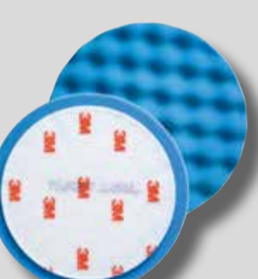
Ø 80 mm 3M™ Hookit™ munakkeno vaahtomuovialikka Tuoteno 50457