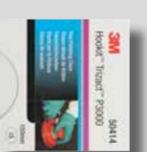
Ø 150 mm 3M™ Trizact™ 3000 Tuoteno 50414