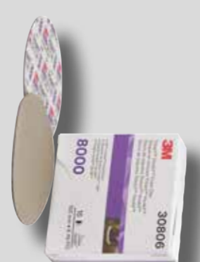
Ø 150 mm 3M™ Trizact™ 8000 Tuoteno 30806