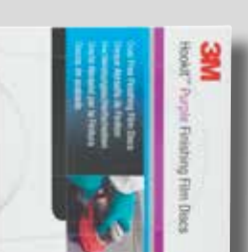
Ø 150 mm 260L P2000 15 reikää: Tuoteno 51304