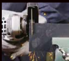
薄い板でもブレずに安定

入り込みが良いから弾かれることがなく、事故のリスクが軽減される。軽い力で安全に作業できます。