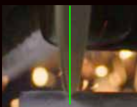
3M™ 切断砥石 51782 弾かれず、狙い通りに切れる