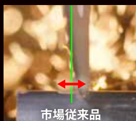
市場従来品 弾かれて、左右にブレる