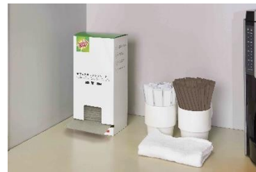
スコッチ・ブライト™ オフィスキッチンクリーナー

環境への配慮などから使い捨てカップではなく、マイカップをオフィスで使用する機会が増えており、会社全体の取り組みとしてマイカップを推奨している企業もあります。3Mが実施した調査によると、オフィスで1日1回以上カップなどの洗い物をする人が80%以上いることがわかりました※。一方、職場の給湯室で共用のスポンジを使用することに対しては、「衛生的でない」「交換時期がわからない」などの点で抵抗感を感じている人が多いこともわかっています。