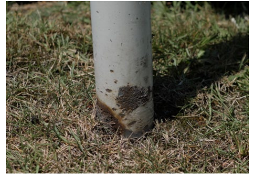
さびにより腐食したポール

塗装のように塗りムラが発生しないため、作業者の熟練度による仕上がりのばらつきが無く、経験者でなくても簡単に作業が可能です。