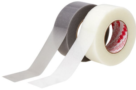
3M™ さび止めテープ 4410

スリーエム ジャパン株式会社（本社：東京都品川区 代表取締役社長：スティーブン ヴァンダーウ）は 12 月 20 日、インフラを始めとした金属構造物のさびを防ぐ「3M™ さび止めテープ 4410」を発売します。貼り付けるだけの簡単施工で工期短縮を可能にし、人手不足の現場の負担軽減に寄与します。