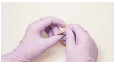
端から剥がしにくい