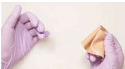
接着面同士がくっついてしまう

伸縮テープの剥離紙を剥がす時に剥がしにくかったり、接着面同士がくっついてしまうことはありませんか？