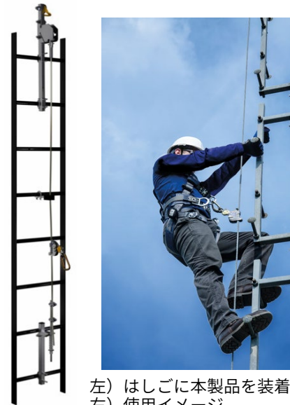
左) はしごに本製品を装着した図 右) 使用イメージ