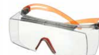
SF3701SGAF-ORG Lins: Klar Färg på båge: Grå/Orange