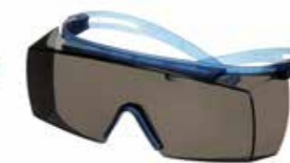
SF3702SGAF-BLU Lins: Grå Färg på båge: Blå/Blå