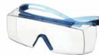
SF3701ASP-BLU Lins: Klar Färg på båge: Blå/Blå