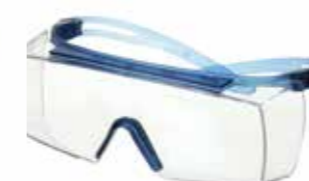
SF3701SGAF-BLU Lins: Klar Färg på båge: Blå/Blå