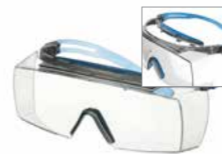
SF3701XSGAF-BLU Lins: Klar Färg på båge: Grå/Blå