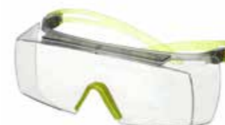
SF3701SGAF-GRN Lins: Klar Färg på båge: Grå/Limegrön