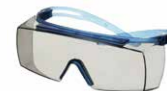
SF3707SGAF-BLU Lins: I/O Grå Färg på båge: Blå/Blå