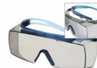
SF3707XSGAF-BLU Lins: I/O Grå Färg på båge: Grå/Blå