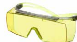
SF3703SGAF-GRN Lins: Gul Färg på båge: Grå/Limegrön