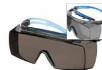
SF3702XSGAF-BLU Lins: Grå Färg på båge: Grå/Blå