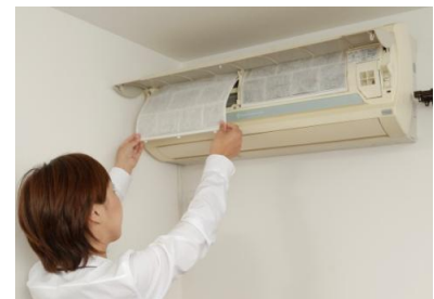
メッシュフィルターに貼るだけで、手軽に設置可能。

エアコンは、室内の空気を循環させるため、室内の空気が汚れていると、汚れた空気が循環し続けることとなります。「フィルタレット™ 空気清浄フィルター エアコン用」は、エアコンのメッシュフィルターに貼るだけで室内の空気を清浄化します。ハイグレードフィルターでは室内の空気中に浮遊しているほこりや花粉、ペットの毛やフケ、カビの胞子等を除去するので、空気清浄機を設置していない部屋でも、エアコンがあれば、空気清浄機能を付加できます。また、エアコン内部やメッシュフィルターの汚れも防止できます。