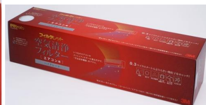
ハイグレードフィルター 左:1枚入り(1台分)、右ロールタイプ(3台分)