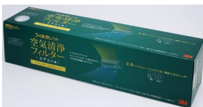
スタンダードグレードフィルター 左:1枚入り(1台分)、右ロールタイプ(3台分)