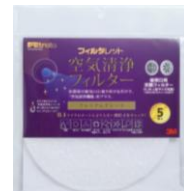
プレミアムグレード