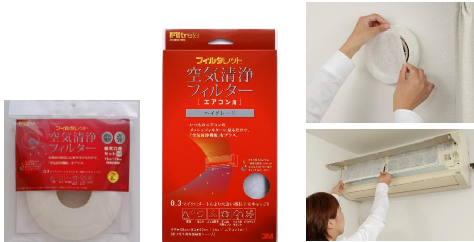
「フィルタレット™ 空気清浄フィルター」 (左:給気口用セット、右:エアコン用)