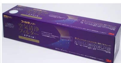
プレミアムグレードフィルター 左:1枚入り(1台分)、右ロールタイプ(3台分)