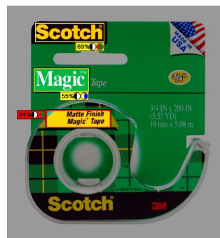
Area of Interest(AOI 機能)