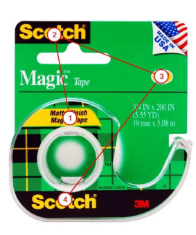
Visual Sequence (視線トラッキング・チャート)