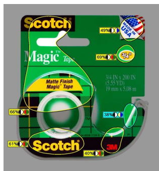
Region Map (リージョンマップ)