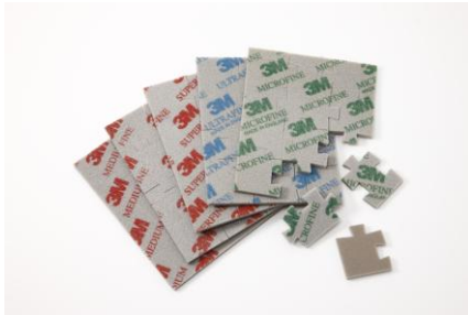
3M™ ジグソーパズル型 スポンジ研磨材 1枚パック