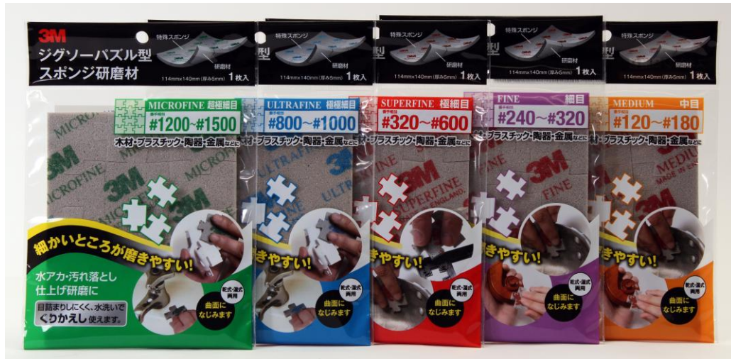
3M™ ジグソーパズル型 スポンジ研磨材 1枚パック 製品一覧表