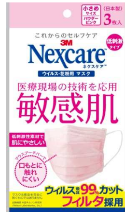
「ネクスケア™ マスク 保湿タイプ」(左:小さめサイズ、右:ふつうサイズ) 「ネクスケア™ マスク 低刺激タイプ」