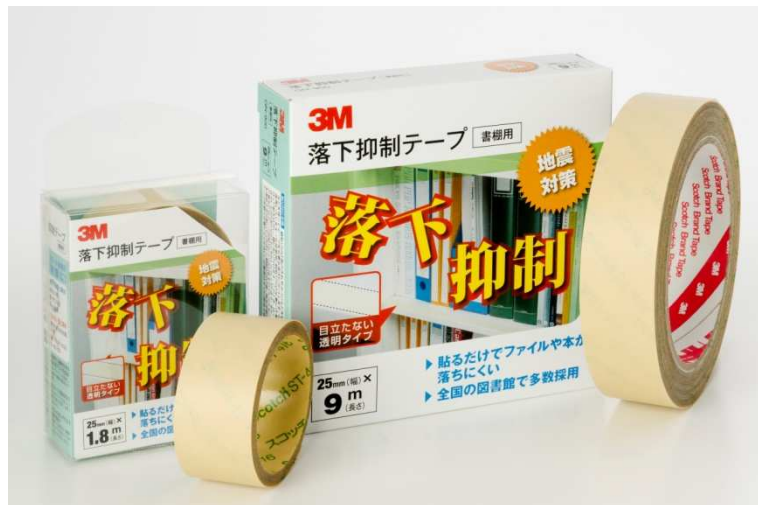
3M™ 落下抑制テープ(書棚用) GNシリーズ(左:1.8m 長、右:9m 長)

住友スリーエム株式会社(本社:東京都世田谷区 代表取締役社長:三村 浩一)は、既存の書棚の前端に貼るだけで、地震による書籍やファイル等の落下を抑制する「3M™ 落下抑制テープ(書棚用) GNシリーズ」を8月8日より発売いたします。