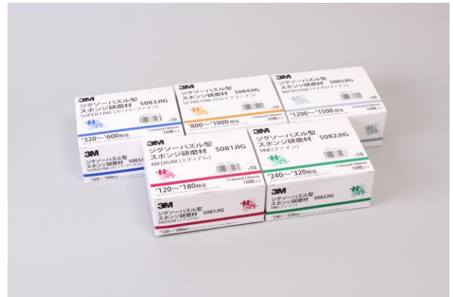
3M™ ジグソーパズル型 スポンジ研磨材

住友スリーエム株式会社(本社:東京都世田谷区 代表取締役社長:三村 浩一)はこのほど、 3M™ ジグソーパズル型 スポンジ研磨材 の販売を開始しました。1994年5月に販売開始して以来のロングセラー品の性能はそのままに、作業しやすい大きさにあらかじめ打ち抜き加工された、手作業向けの研磨材です。