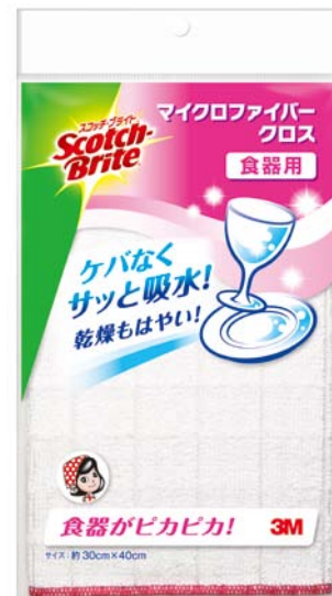
スコッチ・ブライト™ マイクロファイバークロス 食器用