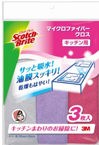
スコッチ・ブライト™ マイクロファイバークロス キッチン用

住友スリーエム株式会社(本社:東京都世田谷区、代表取締役社長:ジェシー・ジー・シン)は、2月21日より、マイクロファイバー素材を使用したふきん、スコッチ・ブライト™ マイクロファイバークロス キッチン用と、スコッチ・ブライト™ マイクロファイバークロス 食器用を発売いたします。