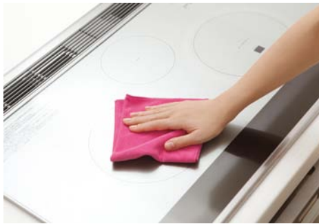
調理台やキッチン家電の拭き掃除に