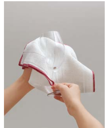
ガラスの仕上げ磨きに