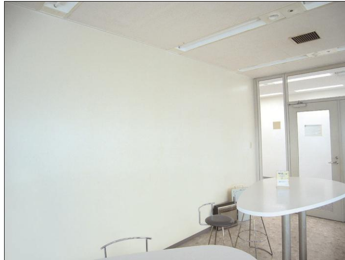
喫煙ルームの壁面に施工したダイノック™フィルム SRシリーズ

住友スリーエム株式会社(本社:東京都世田谷区 代表取締役社長:ジェシー・ジー・シン)は4月15日より、粘着剤付き塩ビ化粧フィルムのトップブランドである3M™ ダイノック™ フィルムの新製品として、タバコのヤニや油汚れ、手垢などの頑固な汚れが付きにくい内装材、3M™ ダイノック™ SRシリーズに新たに6色を追加、販売を開始します。