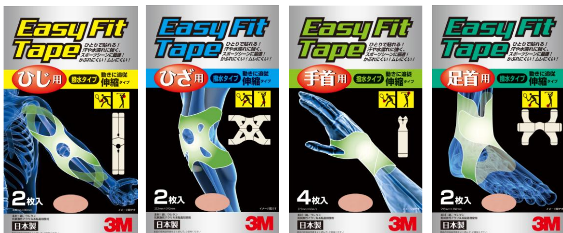
3M™ Easy Fit Tape パッケージ画像

3M™ Easy Fit Tape はフリーサイズで、テニスやゴルフ、サッカー、ジョギング、サイクリングといったスポーツシーンから日常生活における関節サポートやケガの予防まで、幅広くご使用頂けます。